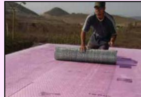
3) Instalação da malha.