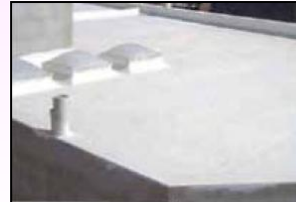
6) Impermeabilizante Acrílico.