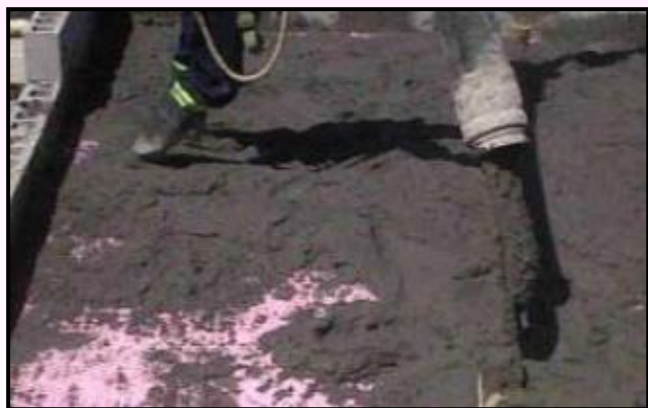
4) Argamassa de cimento (3 cm de espessura)