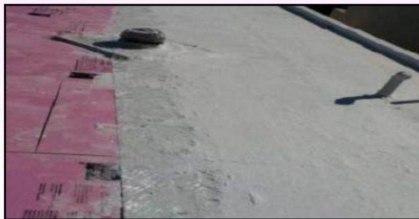
3) Aplicar a segunda mão de Impermeabilizante Acrílico.