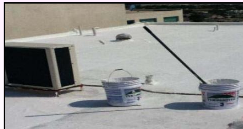
4) Aplicar a terceira mão de Impermeabilizante Acrílico.