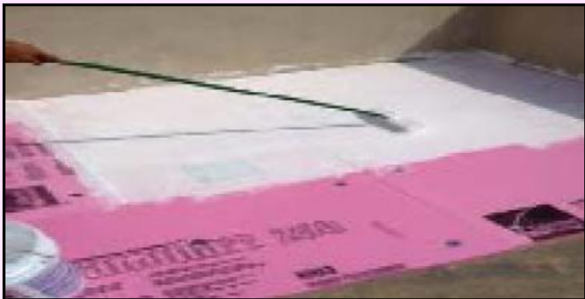
1) Após a fixação mecânica do Foamular, aplicar a primeira mão de Impermeabilizante Acrílico.