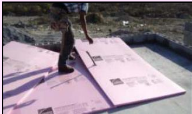
1) Coloque o Foamular sobre a laje de concreto