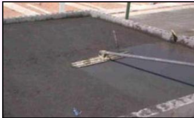
5) Preparar o piso para receber o impermeabilizante.