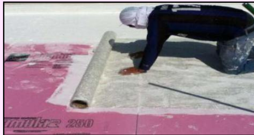
2) Aplicar o CSM (Chop Strand Matt).